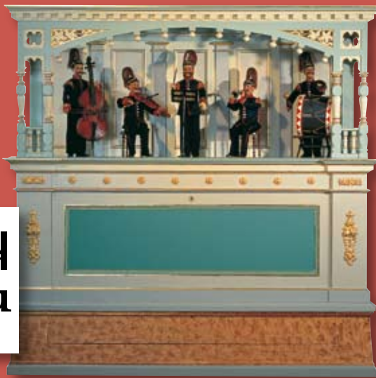
„Automatische Kapelle“ im Elztalmuseum